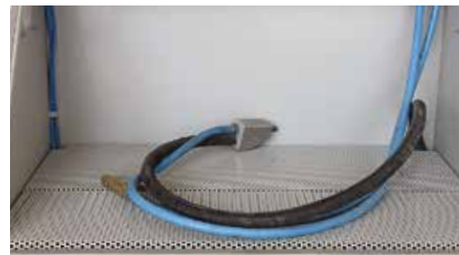
Innenansicht der Injektorstrahlkabine Polyblaster mit Strahlschlauch und zusätzlichem Schlauch für die Reinigungsdüse.