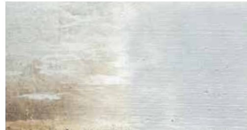
Strahlarbeiten im Polyblaster