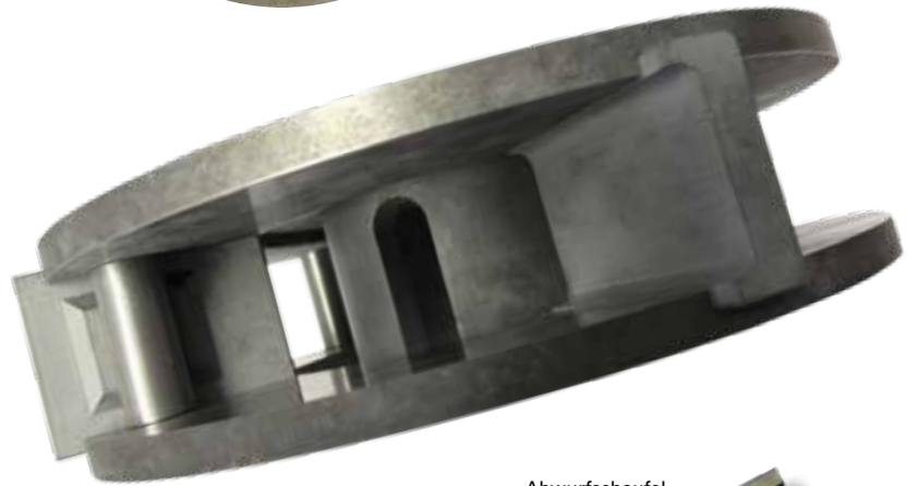
Abwurfschaufel aus Hartmetall