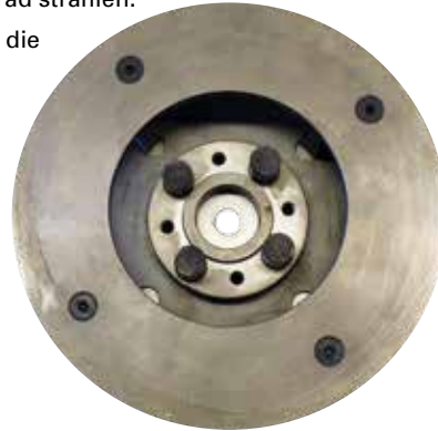
Abbildung: Hartmetall-Schleuderrad für Kugelstrahlmaschine Ausführung kurzschaulig